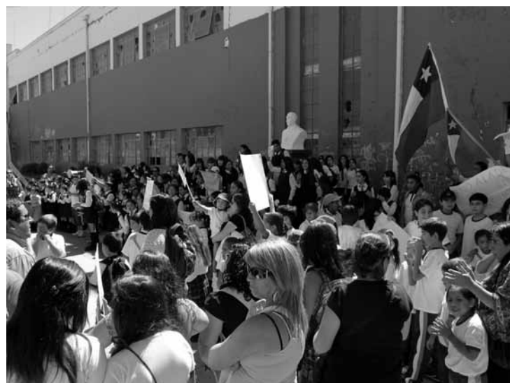
Actividad en defensa de localización actual de las Ex Escuelas Concentradas.

Así, Talca no solo fue una de las ciudades más dañadas por el terremoto, sino que los efectos de este la colocaron en una encrucijada respecto del futuro de uno de sus espacios más significativos y potencialmente más apetecidos por el sector inmobiliario. Esta encrucijada, que ha derivado en disputa, consiste en definir el “valor” del centro histórico de la ciudad: ¿debe tender a incorporarse a la lógica inmobiliaria y potenciar su valor de cambio?, o, dada su significancia para la ciudad, ¿debe más bien ser reconstruido reconociendo y protegiendo su valor de uso?