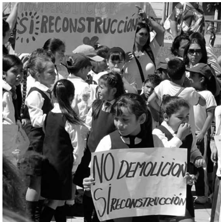
Actividad en defensa de localización actual de las Ex Escuelas Concentradas.

Es posible leer el modelo de reconstrucción implementado como un dispositivo de intervención que ha facilitado al mercado inmobiliario el acceso a zonas de la ciudad que antes estaban fuera de su alcance. El experimento neoliberal postterremoto en la ciudad de Talca ha presionado fuertemente para incorporar en la lógica de mercado un nuevo stock de suelo urbano de alto valor. Para ello, las políticas públicas y los discursos oficiales han tendido a minimizar la dimensión colectiva del proceso de reconstrucción, han desconocido los aspectos socioculturales y los modos de habitar que caracterizaban las zonas afectadas,