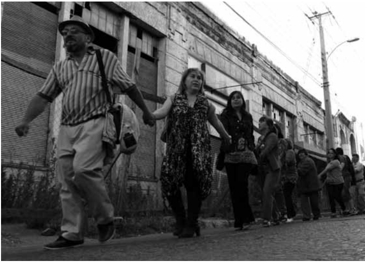
Actividad ciudadana "Abrazo al Mercado Central de Talca".

En las tres dimensiones que conforman los marcos de acción colectiva se han decantado contenidos que han pasado a formar parte de los aprendizajes ciudadanos y que tendrán que consolidarse como marcos para acciones futuras. Esto requerirá un esfuerzo por reconstituir el gran acervo de experiencias colectivas posterremoto y hacer un proceso más sistemático de constitución de los marcos de acción que resultan de ellas.